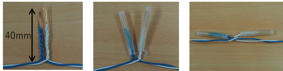
< 接続寸法図 >